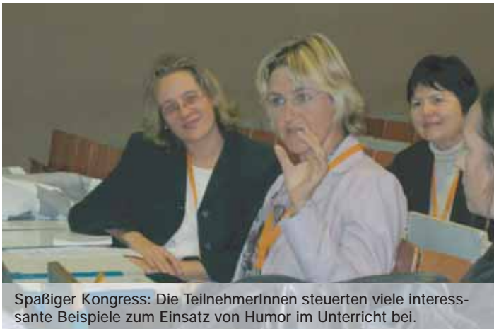
Spaßiger Kongress: Die TeilnehmerInnen steuerten viele interessante Beispiele zum Einsatz von Humor im Unterricht bei.

dieser Tagung mit dem Titel „Sprachen schaffen Chancen“ immer wiederkehrende Probleme, die in Sektionen, Plenumsvorträgen und Diskussion auf Fluren und bei Abendessen aufgegriffen wurden: Wo geht es hin mit dem Fremdsprachenunterricht? Wo geht es hin mit der neuen Technik und uns Lehrenden? Und in jeder Ecke wurde deutlich, dass die Anwendung neuer Technologien zwar neue Möglichkeiten eröffnet, einiges Bisherige erleichtert und uns stupide Korrekturen abnimmt, aber dadurch einen erhöhten Betreuungsaufwand erfordert und unsere Korrekturenergie weiterhin verlangt – nur auf höherer Stufe. Diese Erkenntnis hatte von jeder von uns erlangt – ob aus Didaktik-Lehrveranstaltungen, Ausspracheschulung oder Sprachkursen, die Studierende ein Instrumentarium für autonomes Lernen aufzeigen wollen.